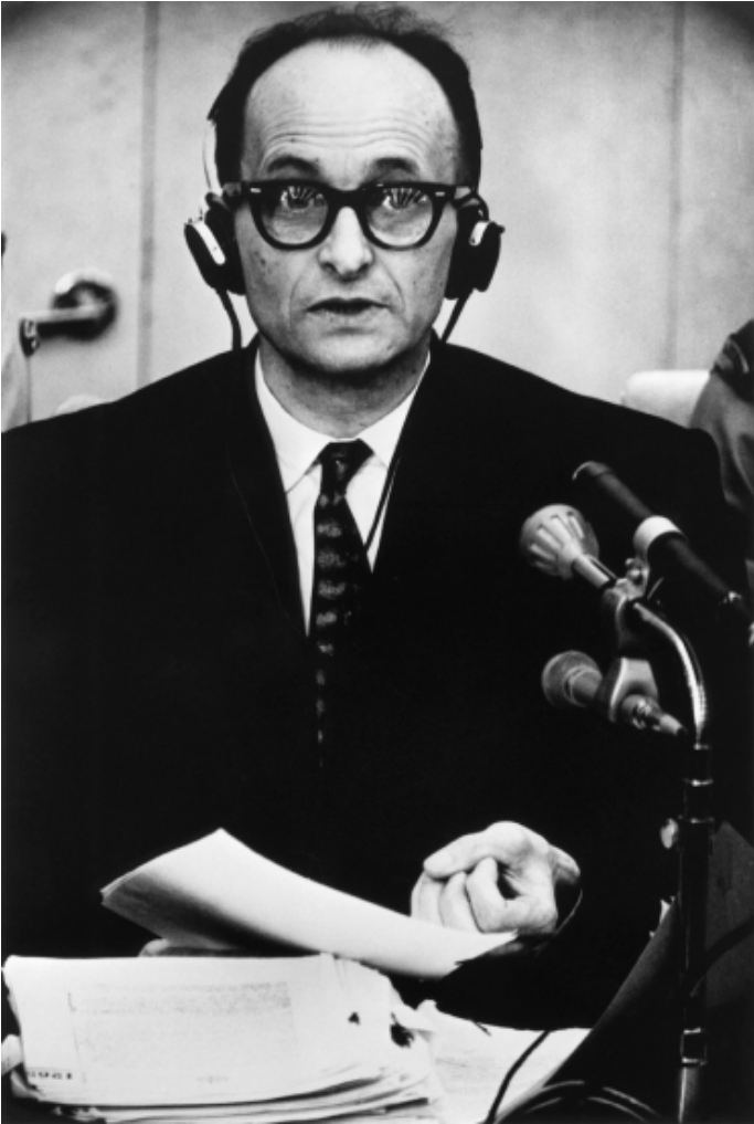
Aldolf Eichmann tijdens zijn proces in Jeruzalem, 1961